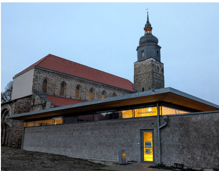
Abb.: Melanchthonhaus Thalbürgel, u.a. LEADER-Projekt und Ort der Vorstandssitzung am 28.01.2025

Die Anträge wurden an das TLLLR in Gera (Bewilligungsbehörde) übergeben. Sobald die Antragstellenden einen Zuwendungsbescheid erhalten, dürfen sie mit der Umsetzung ihrer Vorhaben beginnen.