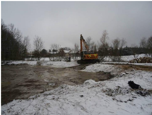
Kleingewässer bei Gösen

Nördlich von Gösen, im FFH-Gebiet 132 „Beuche-Wethautal“, liegt ein Kleingewässer, welches dem Nördlichen Kammolch ( Triturus cristatus ) sowie weiteren Amphibienarten als Lebensraum dient. Das ehemalige Stillgewässer war sehr stark verlandet, aber dennoch das letzte Laichgewässer des Kammolches in der Region. Im Rahmen eines NALAP-Projektes wurde der Lebensraum im Januar 2021 entschlammt und somit als Habitatfläche erhalten bzw. wieder hergestellt. Weiterhin wurde der sehr dichte Baumbestand im Uferbereich aufgelichtet, um die Beschattung des Gewässers zu reduzieren.