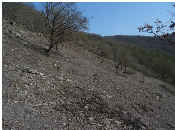
Fläche im „Frauenprießnitzer Holz“ nach Abschluss der Erstentbuschung

Im Februar 2021 wurde der erste Durchgang einer Pflegemaßnahme im FFH-Gebiet 243 „Frauenprießnitzer Holz und Laase“ abgeschlossen. Die etwa 0,7 ha große Fläche mit Kalkschutthalden und Trockenrasen am so genannten „Stöckelstieg“ ist Standort geschützter und seltener Pflanzenarten wie Purpur-Knabenkraut, Berg-Kronwicke und Diptam. Durch Brache und daher aufkommende Gehölze waren die Bestände vom Erlöschen bedroht. Um dem entgegenzuwirken, wurde durch die Natura 2000-Station eine Erstpflege initiiert, die aufgrund der steilen Hanglage eine Herausforderung für das ausführende Unternehmen darstellte. Um den in diesem Jahr zu erwartenden Neuaustrieb der zurückgeschnittenen Gehölze zu reduzieren, ist für den kommenden Winter eine Nachentbuschung geplant. Zunächst einmal dürfen die Blütenpflanzen der Trockenrasen den Sommer auf der wiederhergestellten Fläche aber „genießen“ und hoffentlich blühen.