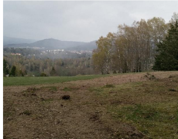
Abb. 3: Eine Modellfläche vor (links) und nach (rechts) einer Nachpflege.

Wer Interesse hat, dieser Kooperation beizutreten, über geeignete Technik verfügt oder über Flächen mit Nachpflegebedarf, wendet sich bitte an: