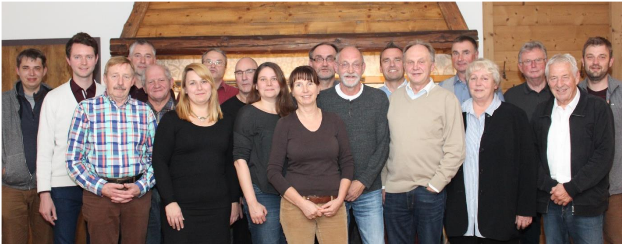
Abb. 3: RAG-Exkursionsteilnehmer 2019

Neben den vielen interessanten Projekten und Begegnungen diente die Exkursion aber vor allem auch dem Austausch und der Vernetzung untereinander.