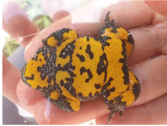
Abb. 2: linkes Bild: Kleinstgewässer auf angrenzender Weide; rechtes Bild: Gelbbauchunken-Fund

Kontakt: Dirk Senkpiel (Tel. 036693/2309-47, d.senkpiel@rag-sh.de )