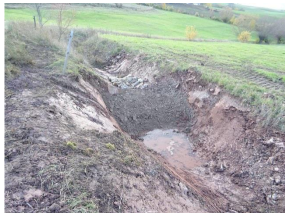
Abb. 1: Laasaner Graben

Eine Informationstafel wird künftig Spaziergänger und Anwohner über das Projekt und die Lebensweise der Gelbbauchunke aufklären.