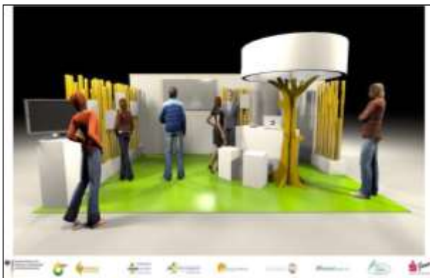
Abbildung 21: Entwurf Messestand der Thüringer Bioenergieregion

den Themen „Maiswüsten“, „Bioenergiedörfer“, „Bürgerbeteiligung“, „EE-Radweg“ und „Energie (be)greifen“ lassen sich an den Raumteilern aus Pappelstangen flexibel inszenieren. Der Baum dient als Eyecatcher, wie auch als Station für multimediale Informationen. (vgl. Anlage 4d) Den ersten kompletten Einsatz hatte der Messestand zu den „Grünen Tagen“ in Erfurt im September 2014. Ergänzt um ein „Energiefahrrad“ wurde zudem der Energieverbrauch einzelner Endgeräte (Wasserkocher, Radio, Lampe) verdeutlicht und mittels eines Holzkamin-Modells mit Monitor und Säulenexperiment das Thema „saubere Verbrennung von Scheitholz“ dargestellt.