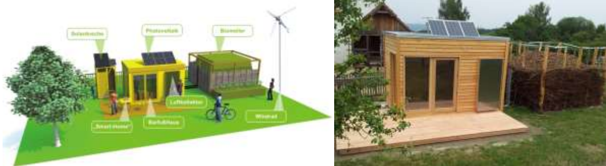
Abbildung 13: Konzept (links) und fertig gestelltes BarfussHaus (rechts)

Gemeinsam mit zirka 70 jungen Europäerinnen und Europäern gelang es 2012, in nur vier Tagen das BarfussHaus zu errichten. Das Haus selbst besteht zum Großteil aus nachwachsenden Rohstoffen, verbraucht wenig Ressourcen und ist mit zahlreichen, innovativen sowie nachhaltigen Energiequellen ausgestattet: