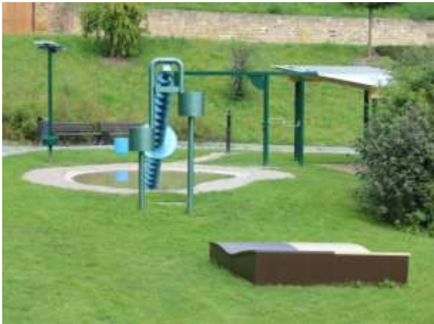
Abbildung 19: „Familienspielplatz erneuerbare Energien“ in Schkölen

erneuerbare Energien“ in der Bioenergiestadt Schkölen. Gemeinsam können hier Jung und Alt erneuerbaren Energien und deren zugrunde liegenden physikalischen Gesetze spielerisch erforschen.