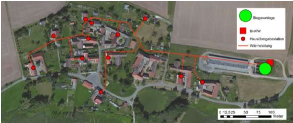
Abbildung 11: Geplantes Wärmenetz in Lotschen (eigene Darstellung mittels ArcGIS 10.0)

Wärmeversorgung Mörsdorf – die BGA des Agrarunternehmens vor Ort hat ein sehr hohes Aufkommen an Restbiowärme. Nach Versorgung der eigenen Liegenschaften wie Schweinestallungen und Fleischerei könnten noch ein unmittelbar angrenzendes Wohngebiet sowie öffentliche Gebäude (Kindergarten und Dorfzentrum) abgedeckt werden. Es wurden zwei Anläufe unternommen, um die möglichen Partner im Ort zusammen zu bringen. Zuletzt angeregt durch die Bürger des Ortes selbst. Leider fehlt es für die Umsetzung eines solchen Nahwärmenetzes am politischen Willen innerhalb der Gemeinde. Ohne Unterstützung der Gemeinde wird eine Maßnahme schwer durchführbar sein. Der Agrarbetrieb besitzt das notwendige Potential zur Wärmeversorgung, allerdings ist die Eigeninitiative auch hier sehr gering. Es bedürfte äußerst intensiver Bürgerbeteiligung zur Überzeugung des Gemeinderates.