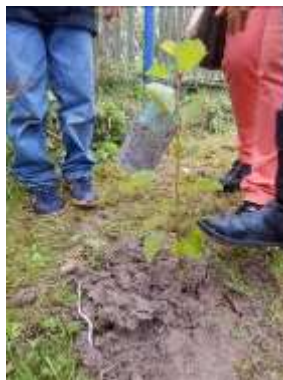
Abbildung 16: Schüler der Grundschule Thalbürgel pflanzen Energie