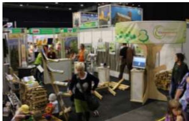
Abbildung 22: Messeauftritt der Thüringer Bioenergieregion zu den „Grünen Tagen“ 2014 in Erfurt

Seither war der Messestand zu unterschiedlichen Veranstaltungen und in verschiedenen Variationen im Einsatz und kann auch künftig aufgrund seiner multifunktionalen und flexiblen Gestaltungsmöglichkeiten gut genutzt werden.