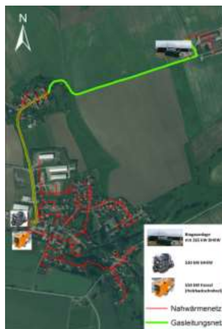
Abbildung 8: Wärmenetz des Bioenergiedorfes Schlöben (eigene Darstellung mittels ArcGIS 10.0)

Bioenergiedorf Schlöben – Bis Mitte 2011 wurde die Idee des Bioenergiedorfes konzipiert, die technische Ausstattung mit BGA und Wärmenetz nebst BMHW erarbeitet und der Beteiligungsprozess mit der Bevölkerung mündend in die Bürgergenossenschaft "Bioenergiedorf Schlöben eG" begleitet. Während des Jahres 2012 wuchs und reifte das Bioenergiedorf Schlöben in Gänze mit einer 795 kW el BGA, 2 Satelliten-BHKW, einer 1,6 km langen Biogasleitung und eines kombinierten 5,6 km langen Wärme- und Glasfasernetzes. Der Winter 2012/2013 war als erster „genossenschaftlicher Winter“ höchst erfolgreich, da hier alle Komponenten bewiesen, dass bis zum letzten Haushalt alles durchgewärmt war. Dies ermunterte auch noch so manchen Zweifler, sich an das Wärmenetz anschließen zu lassen. Somit werden heute mehr als 70 % der Haushalte, die Schule, der Kindergarten und die Gemeindeliegenschaften der Ortsteile Schlöben und Zötnitz mit Biowärme versorgt.