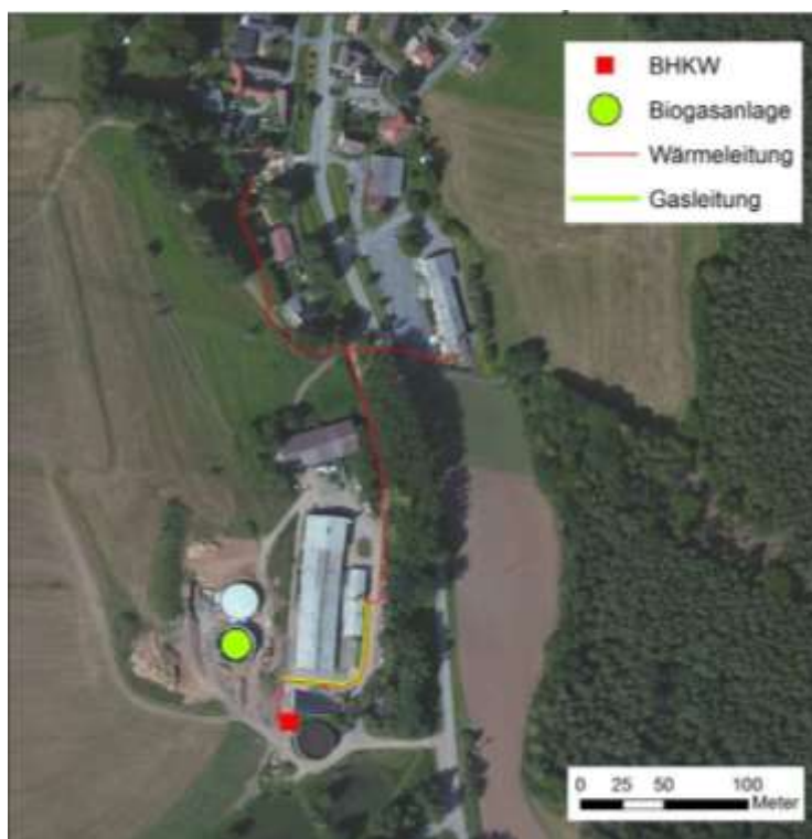
Abbildung 9: Wärmenetz in Weißbach (eigene Darstellung mittels ArcGIS 10.0)

Weißbach – Schon bei der Konzipierung der BGA müssen Aspekte bzgl. Standort sowie die Substratlogistik intensiv bedacht werden, weil dies nicht zuletzt die Akzeptanz vor Ort beeinflusst. Sehr gut gelungen ist uns dies am Standort der Agrargesellschaft Weißbach. Die sehr gute Kooperation zwischen Agrarunternehmen und Kommune spielte auch hier die entscheidende Rolle zur Umsetzung des Wärmekonzeptes. Die Landwirtschaft als Lieferant der Biomasse und die Kommunen als Abnehmer der Energie. Durch das gute Zusammenwirken aller Beteiligten (Bürgermeister, Vorsitzender der Agrargesellschaft und Team der Bioenergieregion) und die Bündelung der Kompetenzen war es möglich geworden, nach aufwendiger Vorplanung bzgl. Trassengestaltung, Finanzierungsoptionen und Genehmigungen die Bauphase zügig voranzutreiben und auf 2 Monate zu begrenzen.