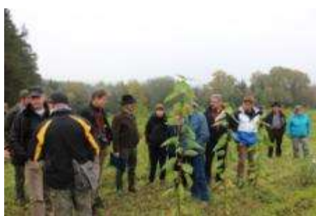
Abbildung 6: links: Robinien-KUP bei Tissa, rechts: Biomasserundfahrt 2014 nach Tissa

Ein durch die Bioenergieregion Jena-Saale-Holzland erstellter praktischer Leitfaden (vgl. Anlage 4e) dient als Handlungsempfehlung und Unterstützung für die Anlage von Kurzumtriebsplantagen (KUP) in der Region. Es werden die Chancen und Herausforderungen auf dem Weg zur KUP-Anlage veranschaulicht und ein kurzer Überblick zur Produktion von Holz hackschnitzeln gegeben, um mögliche Hemmnisse abzubauen. Die Wirtschaftlichkeit wird an ausgewählten Pilotflächen betrachtet, so dass Betreibern und Investoren eine Planungsgrundlage zur Verfügung gestellt werden konnte. Die Nutzung von Splitterflächen, Grenzertragsstandorten und Konversionsflächen spielt hierbei wirtschaftlich gesehen eine besondere Rolle als Alternative zu bereits ackerbaulich genutzten Flächen.