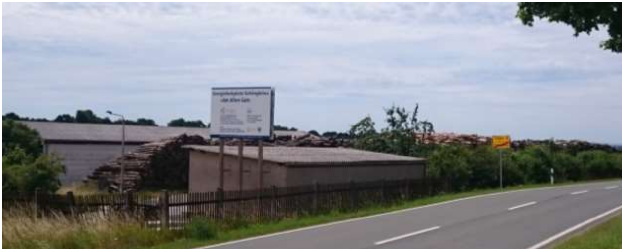
Abbildung 14: Energieholzplatz Schöngleina

Exklusivlieferant), in Schöngleina ein optimaler Standort für eine Holzlagerung und Aufbereitung gefunden. Nicht zuletzt können wir nun so das Angebot erstklassiger Holzhackschnitzel in der Region bewerben und auch bereits in mehreren Anlagen einsetzen (Schlöben, Nickelsdorf u.a.). Damit wurde ein wichtiger Grundpfeiler für den effektiven Ausbau von Heizanlagen auf Basis fester Biomasse geschaffen.