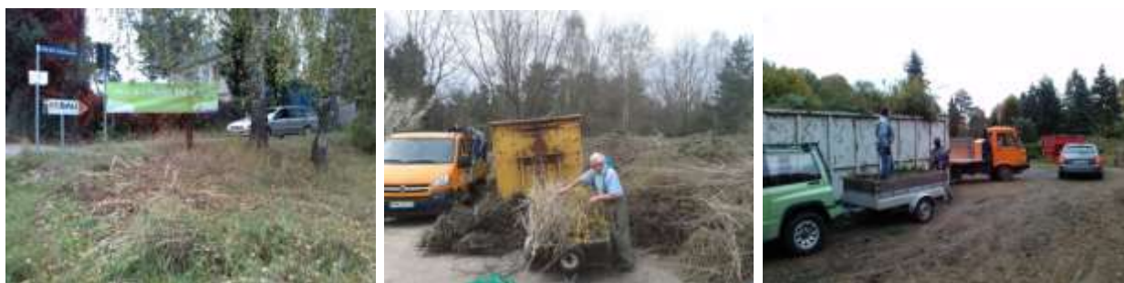
Abbildung 15: Sammlung von Ast- und Strauchschnitt in Bad Klosterlausnitz

Das Projekt wurde durch eine intensive Öffentlichkeitsarbeit über Presse, Banner an den Sammelplätzen, Informationsblätter, Anzeigen in den Abfallkalendern (SHK, Jena) sowie durch Videoaufnahmen begleitet.