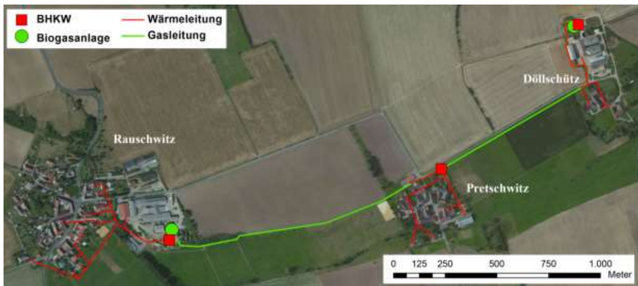
Abbildung 10: Wärmenetz in Döllschütz-Pretschwitz (in Planung: Gasleitung von Pretschwitz nach Rauschwitz sowie Wärmenetz in Rauschwitz) (eigene Darstellung mittels ArcGIS 10.0)

Erklärtes Ziel der Abtei Energie GmbH war und ist es nach wie vor, auch die Ortschaft Rauschwitz zu erschließen. Auch deren BGA muss perspektivisch zur Biogaserweiterung ertüchtigt werden, um ausreichend Wärme in den Ort zu speisen. Hierfür braucht es jedoch noch weitere Unterstützungsleistung; beispielsweise durch das Nachfolgeprojekt der BioER.