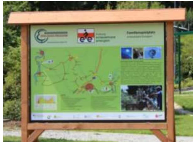
Abbildung 20: Beschilderung des „Familienspielplatz erneuerbare Energien“ am EE-Radweg

Der „Energiespielplatz“ entstand auf Initiative der BioER JSH als kleines Highlight auf dem EE-Radweg. Er wurde mit Hilfe des Ingenieurbüros Bolze, Scherf, Ludwig konzipiert und in Trägerschaft der Stadt Schkölen als LEADER-Innovationsprojekt umgesetzt und betrieben. Die Stadt hat sich weit über die eigentliche Förderung engagiert und damit die Attraktivität des Radweges, wie auch der Region, unterstrichen. Ein aktueller Fernsehbericht „Unterwegs in Thüringen“ (Ausstrahlung am 01.08.2015) macht das deutlich. (vgl. Anlage 4c)