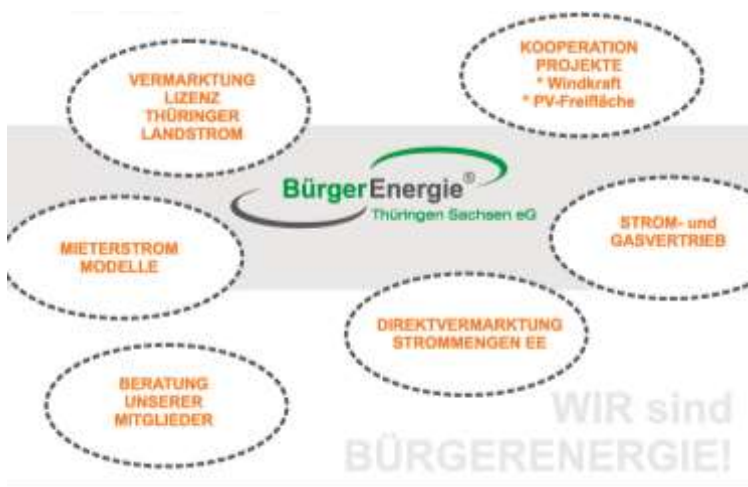
Abbildung 7: Arbeitsfelder der BETS eG i.G.