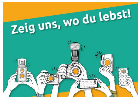
Abb. 2: Aufruf zum Fotowettbewerb

2020 stand die Idee eines Fotowettbewerbs, um die Bewohner der Region auf den anstehenden Strategieprozess einzustimmen. Sie sollten dazu angeregt werden, sich mit der eigenen Region und ihren Besonderheiten auseinander zu setzen und darüber RAG und LEADER kennen lernen. Dies ist trotz Corona gut gelungen (198 Einsendungen). Der Wettbewerb begleitete die Region über das ganze Jahr hinweg. Wichtige Stationen waren: Aufruf, Vorauswahl durch Jury, öffentliche Online-Abstimmung, Ausstellung im Landratsamt, Preisverleihung und Kalender. Dadurch war die RAG zahlreich in der Presse vertreten. Zudem ist es über den Kalender gelungen, LEADER-Projekte vorzustellen. Damit haben wir große, positive Resonanz erfahren.